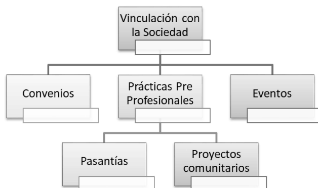
2.1.1.1 Gráfico 1. Estructura de las Acciones del Departamento de Vinculación con la Sociedad

Las acciones que realiza el Departamento de Vinculación con la Sociedad del Instituto Superior Tecnológico de Formación Profesional Administrativa y Comercial se encuentran ligadas al desarrollo académico y científico para contribuir a resolver colectivamente los problemas de la sociedad, a través de los grupos de atención prioritaria y de los diferentes sectores sociales, instrumentados en convenios o acuerdos específicos: